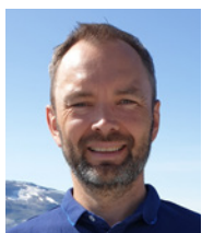
Tom Inge P. Gotten Gjerdsвика