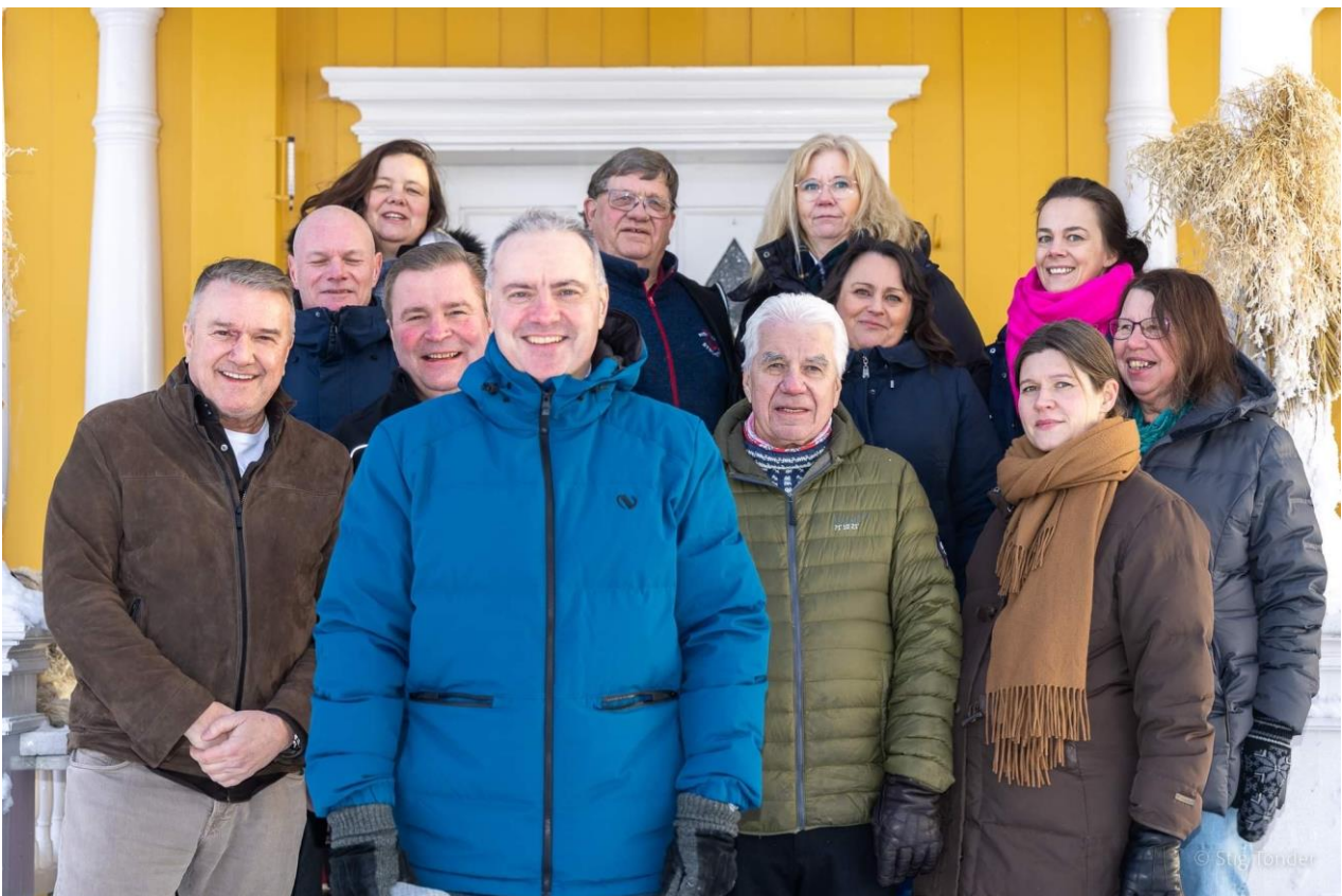
Nittedal Høyre, Granavolden januar 2023