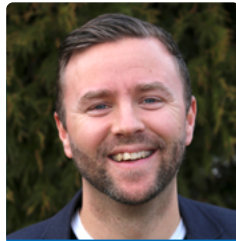
4. BILL CLINTON f. 1980 Frakkagjerd