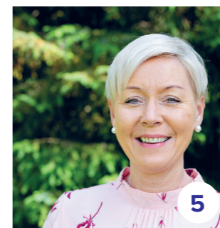
Gunn Dalen Hå