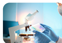
På lag med jobbskaperne