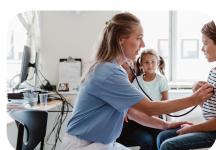
Hjelp når du trenger det