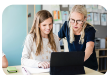
En skole med mestring og motivasjon