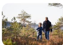
Klima, miljø, kraft og energi