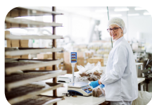
Arbeidskraft og inkludering