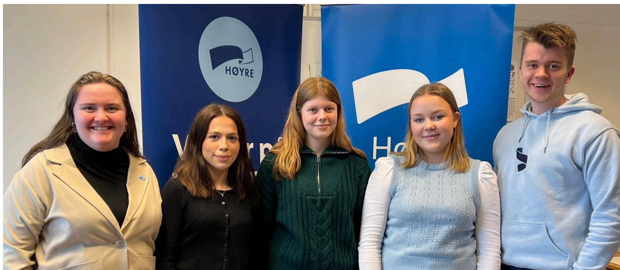
Unge Høyre ble etablert i Harstad i februar i år.

Et kollektivtilbud som fungerer for ungdoms behov, er avgjørende for å knytte kommunen sammen og sikre at alle har mulighet til å delta på sosiale aktiviteter. Harstad Unge Høyre vil også styrke innsatsen for unge med dysleksi og sikre bedre tilgang til helsesykepleier i skolene. Mange unge har utfordringer med mental helse og Harstad Unge Høyre vil styrke tilbudet innen psykisk helsehjelp slik at ventetiden blir kortere.