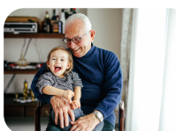
En aldersvennlig kommune

Harstad Høyre er klar for å ta over styringen av kommunen vår og vi vil ta alle gode krefter i bruk for å gjøre Harstad bedre. Vi vil fornye og forbedre de kommunale tjenestene og gjøre Harstad klar for fremtiden. Innovasjon og nyskaping, godt lederskap og medvirkning er stikkord for vår politikk de neste fire årene. Harstad skal være en kommune som sier JA når vi kan og nei når vi må. Gjennom gode prosesser skal vi sammen finne de beste løsningene. Det betyr noe om Høyre får styre Harstad kommune.