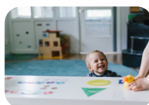
Barnehage til alle