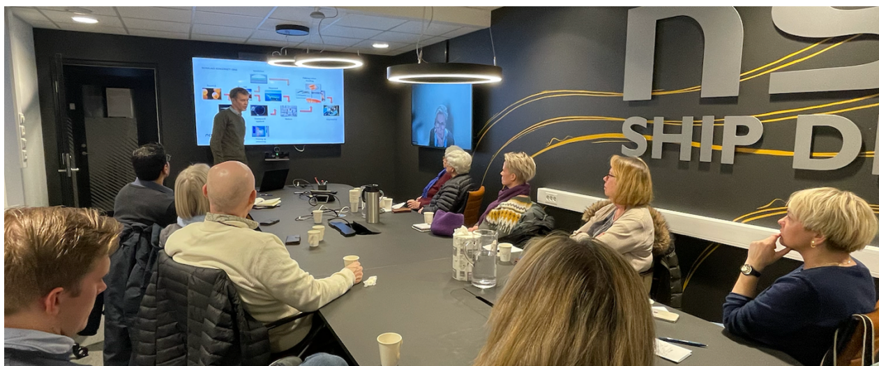
Nordlaks og NSK Ship Design presenterte sitt arbeid på innspillsmøte til våre medlemmer.

Folk i jobb er det som skaper verdiene vi alle nyter godt av. Velferdssamfunnet bygges på skuldrene til norske arbeidstakere og bedrifter. Et godt lokalsamfunn krever sterke bedrifter som skaper arbeidsplasser og muligheter. Harstad Høyre vil at Harstadregionen skal bli det beste stedet for å drive næringsutvikling og etablere nye arbeidsplasser. Vi skal være en kommune som sier JA mer enn nei og vi må tiltrekke oss talentene. Kommunen i samspill med næringslivet må jobbe for at vi har interessante, innovative og bærekraftige jobber. Det som er viktig for næringslivet, er også viktig for kommunen.