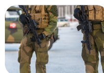
Sikkerhet, trygghet og beredskap