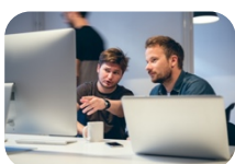
Harstad - den positive kommunen