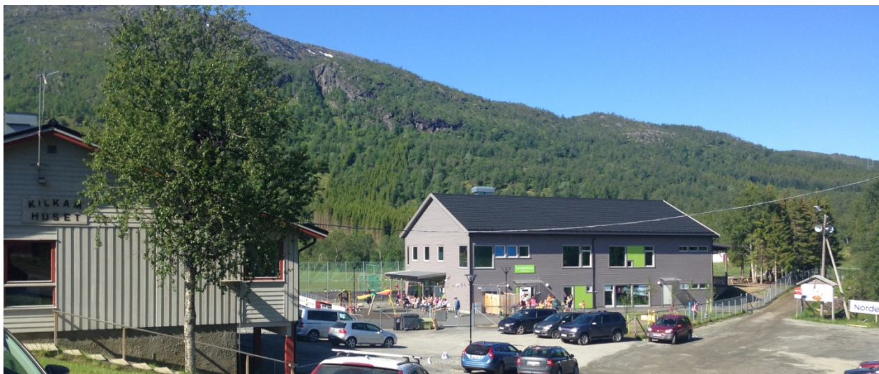
Harstad Høyre vil ta alle gode krefter i bruk, og benytte kapasiteten til våre dyktige private barnehager, som Løvåsen barnehage.

Barnehagen skal være en trygg omsorgsarena og en arena for å lære gjennom lek. Foreldre skal være sikre på at barna trives og utvikles i barnehagen de tilhører. Høyre vil prioritere et kvalitativt godt barnehagetilbud som er tilgjengelig for barn og foreldre når behov for barnehageplass oppstår. I dag står mange barn i kø og mange foreldre opplever at det ikke er barnehageplasser tilgjengelig når lønnet foreldrepermisjon utløper. Harstad Høyre vil teste ut behovsbasert opptak gjennom hele året.