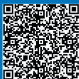
Jarle Skaardal 21. kandidat