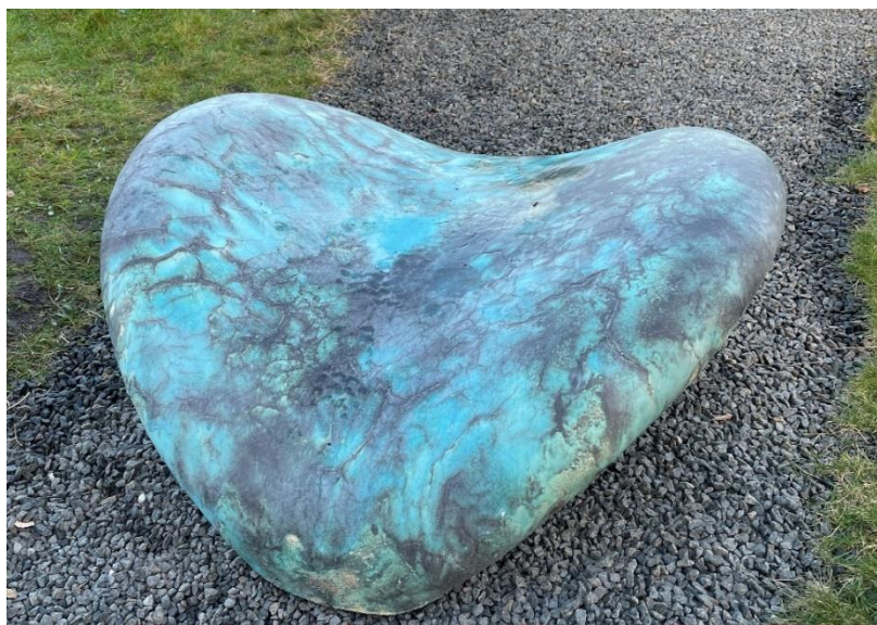
HAVROM av Eirik Gjødrem