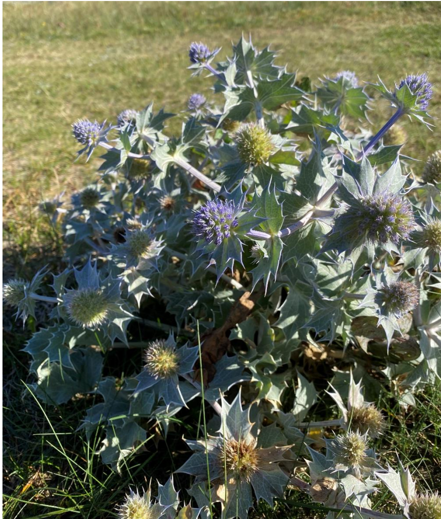
Farsunds kommuneblomst «strandtorn» på Hauge