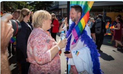
KAMPEN ER SVAR GITT - Det er få land i verden hvor det er så godt å være lesbisk, homofil, eller transperson som her i Norge. Den lange veien vi har gått, må vi ta med oss i et med oss - vårt arbeidstidspunkt, som vår store stolthet og stolte L-Orange. Friheten til å være deg selv